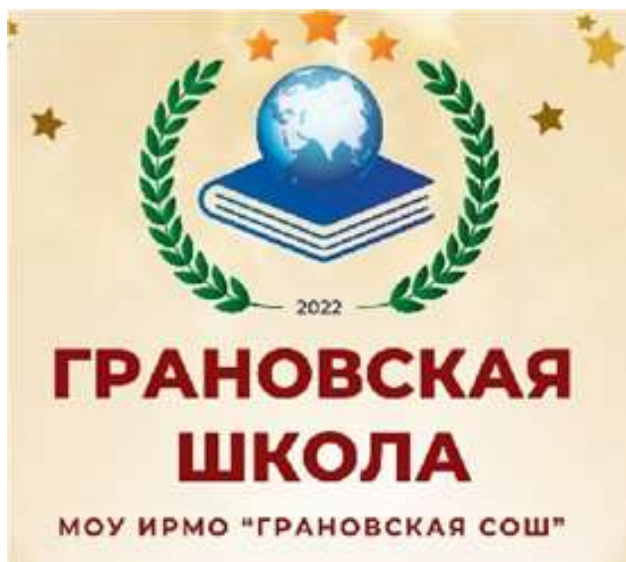
Аттестация педагогических работников I полугодие 2022-2023 учебного года

Без квалификационной категории 73 человека (64%)